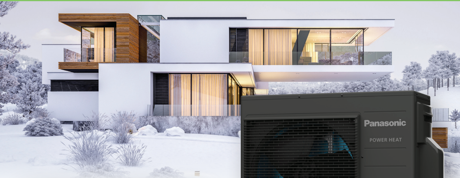
Kompatibilní vnitřní jednotky Ethernia